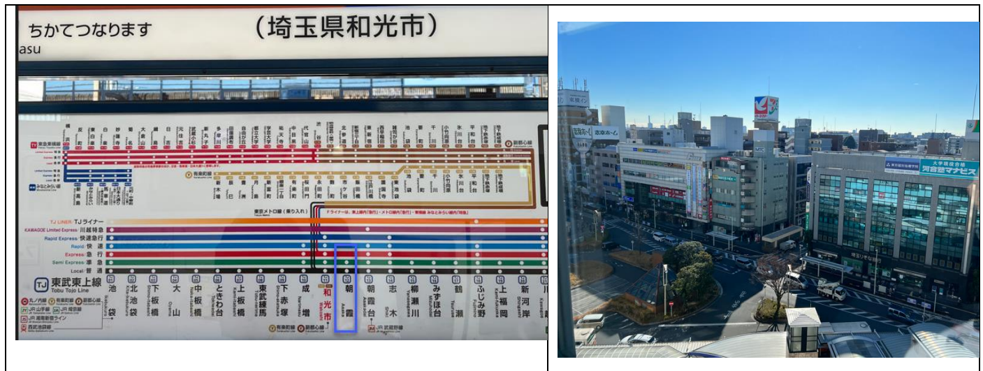
写真 (右上): 東武ホテル 7階からの景色

5. 和光市駅(エキアプレミア和光、東武ホテル、イトーヨーカ堂も徒歩3分程度。)地下鉄の始発駅。